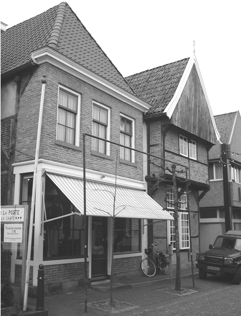
Pand Marktstraat 7 en 9: Modehuis Silvia Tijhuis. (2003)