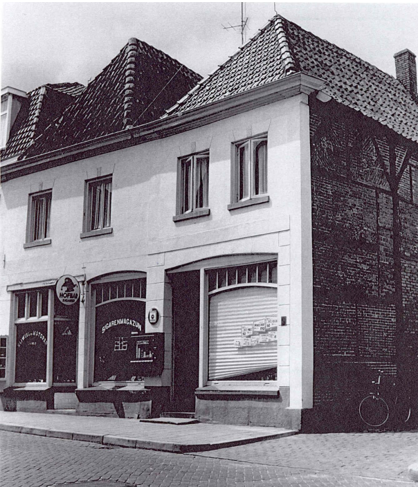
Pand Marktstraat 7 en 9 uit 1963 van de Familie Beld