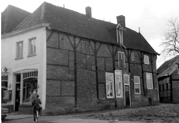
Zijkant van pand Marktstraat 9 (1970)

Boven in de huizen, waar de doorgebroken linkerbuitenmuur van pand nummer 9 en de rechterbuitenmuur van pand nummer 7 goed te zien zijn, is op enkele plaatsen de